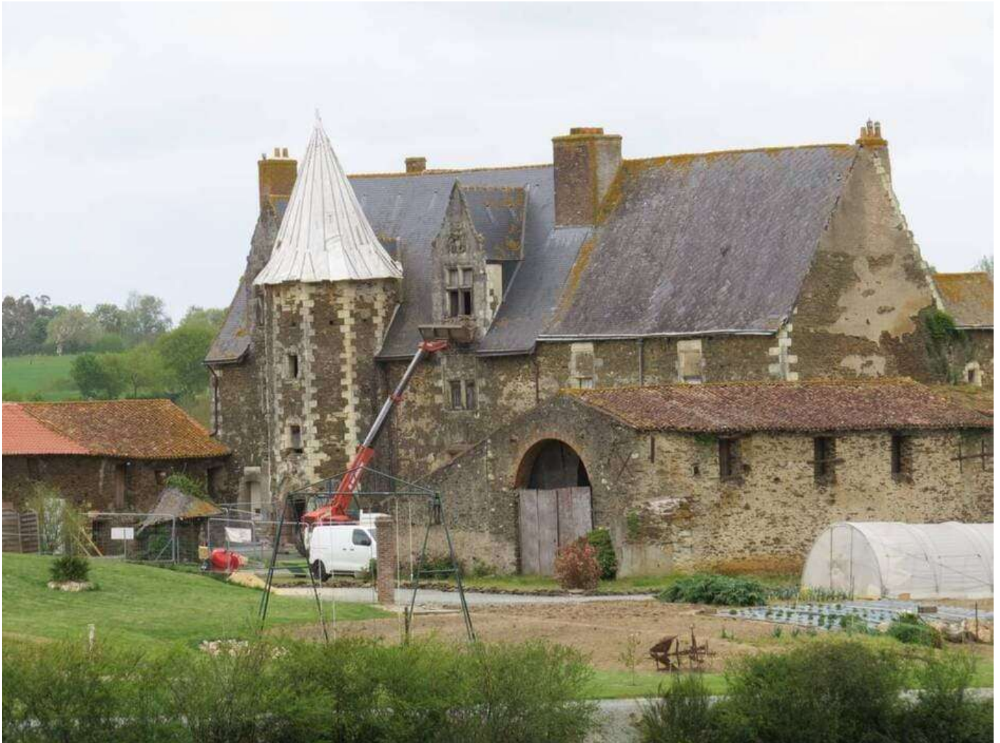
Le manoir de la Chaperonnière à Jallais est inscrit aux Monuments historiques depuis 1978.

D'importants travaux de rénovation ont démarré au château de la Chaperonnière à Jallais (Beaupréau-en-Mauges). Au cours du chantier, des ouvriers ont mis au jour le caveau qui servait de cachette à Jacques-Joseph Cathelineau, le fils du généralissime du Pin-en-Mauges, arrêté et exécuté en 1832.