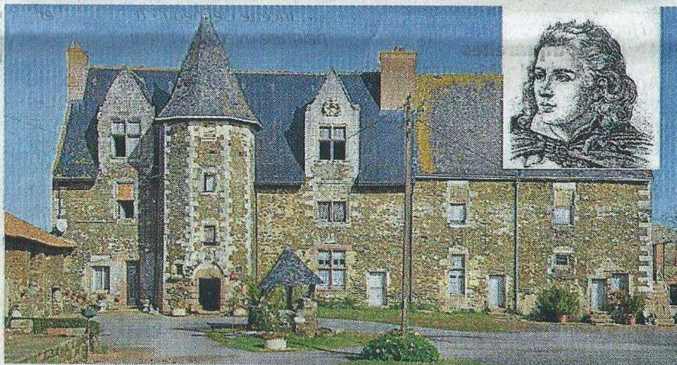
Le manoir de la Chapronnière, avec Jacques Cathelineau en médaillon.

Ce métier explique l'influence qu'il eut dans toutes les Mauges, il les parcourait pour son commerce. Homme de foi vive, chrétien convaincu et entraînant, Jacques Cathelineau n'accepta pas la politique antireligieuse de la Révolution. Le 13 mars 1793, Cathelineau donne dans les Mauges le signal de l'insurrection. Il part avec 28 compagnons du Pin, huit d'entre eux sont de sa famille. Le