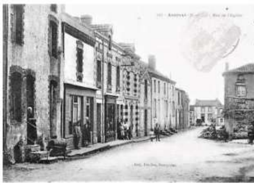
20. - ANDRÉZÉ (M.-et-L.) - Rue de l'Église