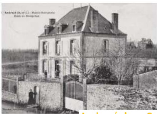
11. - ANDRÉZÉ (M.-et-L.) - Maison historique Place de Beaupré