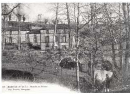
17. - ANDRÉZÉ (M.-et-L.) - Maison de l'Église