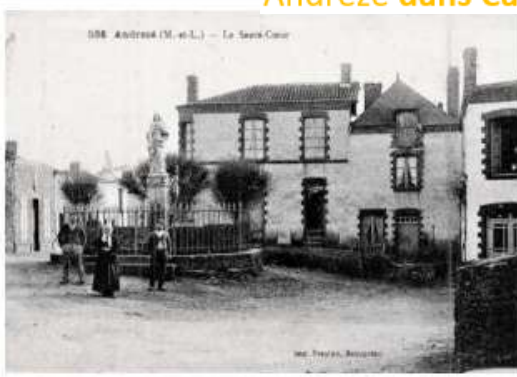
15. - ANDRÉZÉ (M.-et-L.) - Le Sacre-Coeur