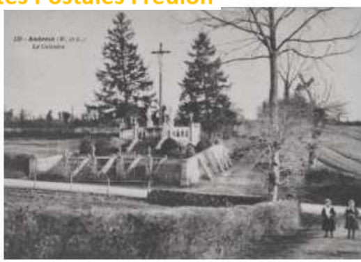
16. - ANDRÉZÉ (M.-et-L.) - La Grande Place