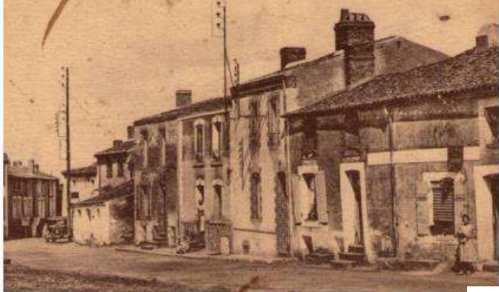
ANDRÉZÉ (M.-et-L.) - Route de Beaupréau