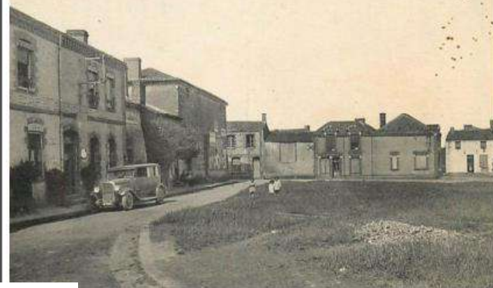
ANDRÉZÉ (M.-et-L.) - La Place de la Mairie - L.V. phot.