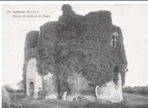
10. - ANDRÉZÉ (M.-et-L.) - Ruines du chateau des Fleurs