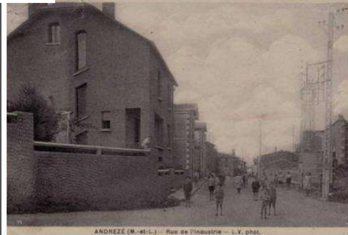
ANDRÉZÉ (M.-et-L.) - Rue de l'Industrie