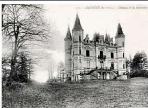
10. - ANDRÉZÉ (M.-et-L.) - Chateau de la Motteville