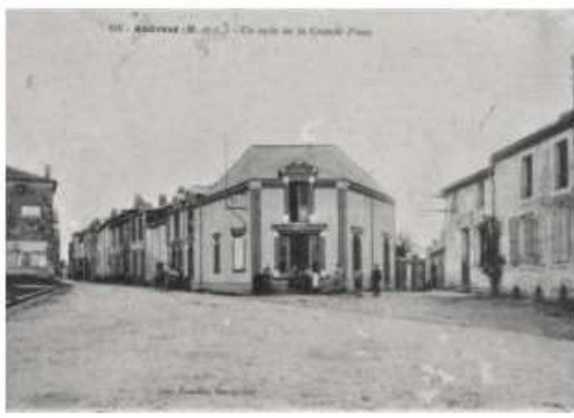
19. - ANDRÉZÉ (M.-et-L.) - En face de la Grande Place