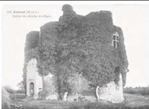
10. - ANDRÉZÉ (M.-et-L.) - Ruines du chateau des Fleurs