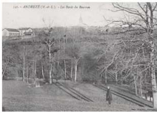
18. - ANDRÉZÉ (M.-et-L.) - Les Bords du Bouron