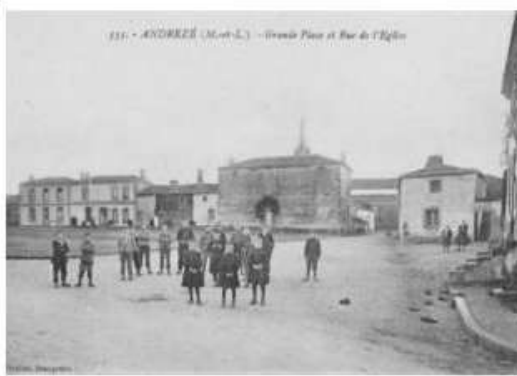
13. - ANDRÉZÉ (M.-et-L.) - Grande Place et Rue de l'Église