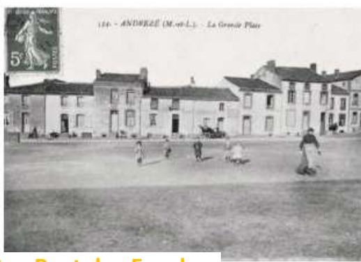
12. - ANDRÉZÉ (M.-et-L.) - La Grande Place