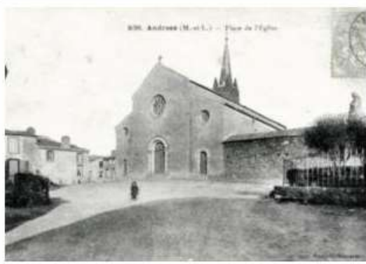
14. - ANDRÉZÉ (M.-et-L.) - Place de l'Église