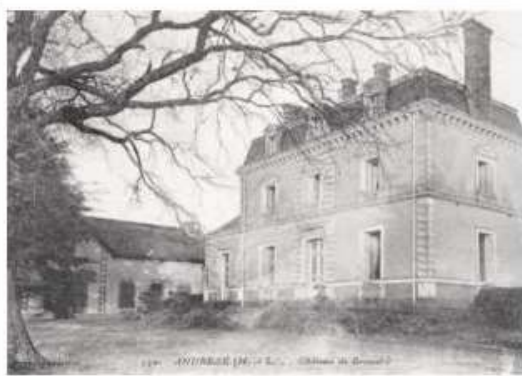
11. - ANDRÉZÉ (M.-et-L.) - Chateau de Grandval