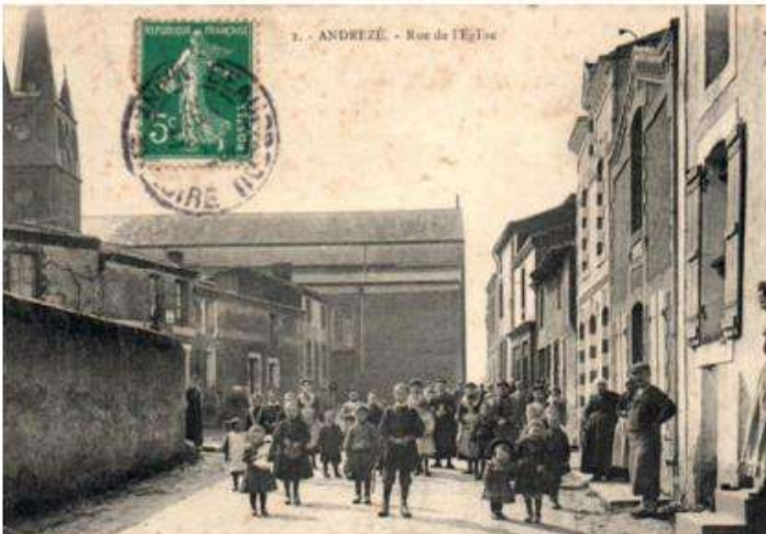
1. - ANDRÉZÉ - vue de l'Église