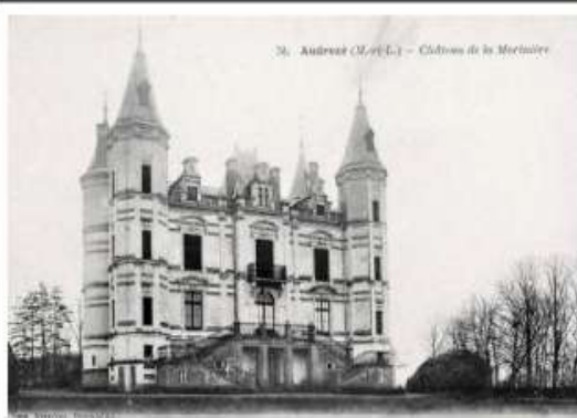
10. - ANDRÉZÉ (M.-et-L.) - Chateau de la Motteville