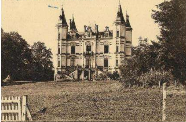
ANDRÉZÉ (M.-et-L.) - Château de la Morinière