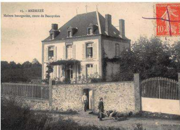
15. - ANDRÉZÉ Maison bourgeoise, route de Beaupréau