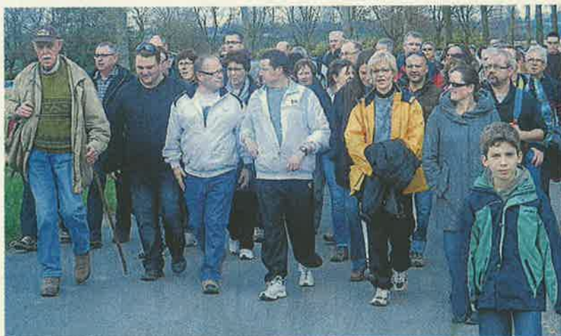
Dimanche matin, départ des randonneurs de l'abbaye de Bellefontaine.