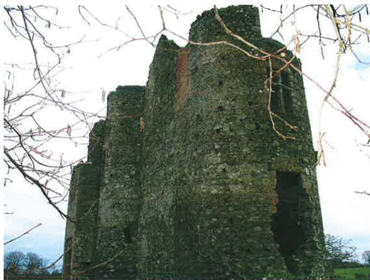
Les Hayes Gasselins : ruines.