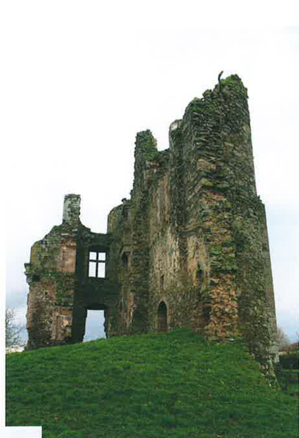
Ruines du château des Hayes-Gasselin à Andrezé