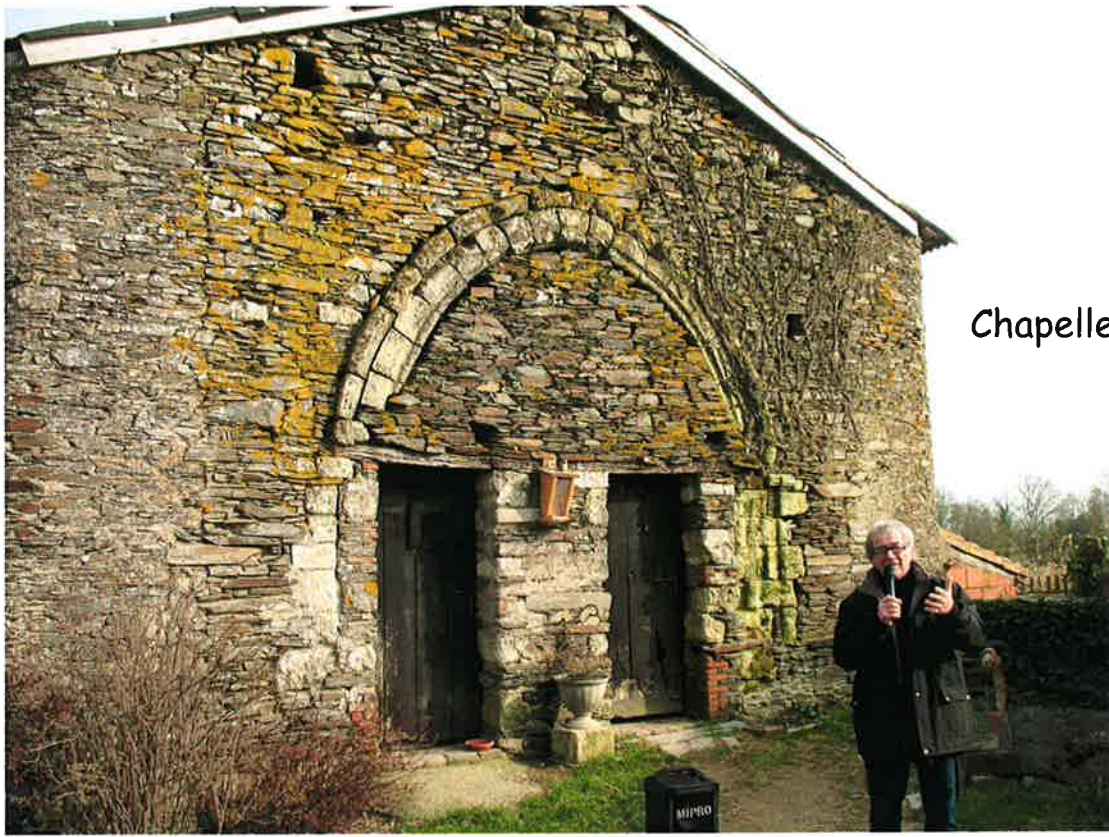
Chapelle de Bois Ferré