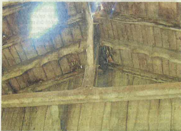
La charpente de la chapelle du Bois-Ferré date du XV e siècle.

En parlant de richesse, il faut remarquer les corniches en génoise à triple rangée sur le bâtiment à suivre, de facture plus récente bien sûr. Donc Bois-Ferré est un gros propriétaire. En dépendaient de vastes landes en pâture, terres labourables, fermes et closeries, qui bien sûr, payaient de lourds impôts à leur maître. Et c'est dans les terriers de l'époque (registre foncier d'une seigneurie), que l'on se rend compte de l'étendue des domaines des Templiers de Bois-Ferré. Rien qu'au sein de la paroisse de Gesté on peut entre autres noter l'Ogerie, la moitié de la Hurterie (Heurtebiche), la Hallerie (la Petite Poterie) et l'Aunay Martin tout proche mais de La Renaudière. De nombreux domaines hors de Gesté dépendent des Templiers de Bois-Ferré dans de nombreuses communes, Villedieu et Clisson, le Puiset, Saint-Romy, Saint-Rémy-en-Mauges, Saint-Martin de Beaupréau, Liré, La Tessouaille, La Toûrmantine, Trémentine, le Fuiet, Saint-Pierre-de-Cholet, Saint-Philibert-en-Mauges, Saint-Germain, Saint-Macqueyre, Saint-Macaire-en-Mauges, Andrezé, La Chapelle-du-Genêt, Neuvy-en-Mauges,