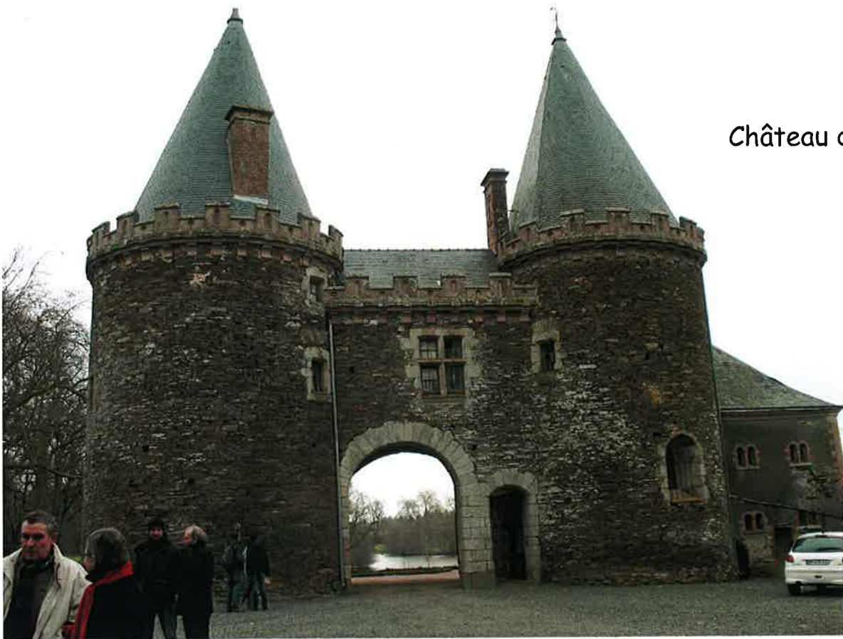
Château du Plessis