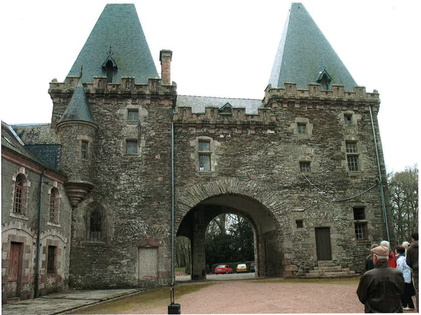
Château du Plessis propriété de Monsieur de Béjarry