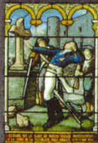
LESCURE « Mortellement blessé près de Cholet »