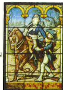
Henri de La ROCHEJACQUELEIN « Blessé, il pardonne à son ennemi »