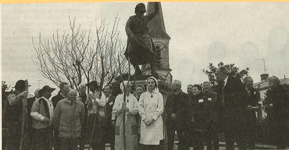
Devant la statue de Jacques Cathelineau et l'église du Pin-en-Mauges, les organisateurs posent ici pour le devoir de mémoire... Pas d'idéologie ici, simplement le rappel des faits et des événements historiques qui s'intègrent la période de la Révolution française.