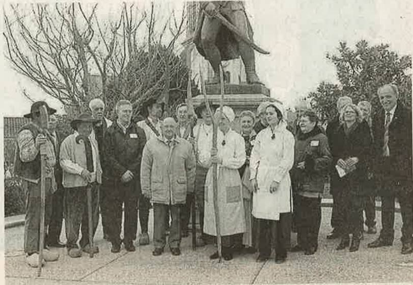
Après le dépôt de gerbe, les officiels, artisans du « circuit des guerres de Vendée » et figurant en tenue de circonstance, posent pour la photo souvenir.

En début d'après-midi, les visiteurs ont emprunté le circuit des guerres de Vendée jusqu'à Jallais.