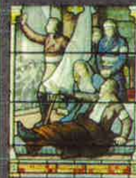
Charles de BONCHAMPS « Grâce aux prisonniers »