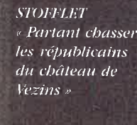
STOFFLET « Partant chasser les républicains du château de Vezins »