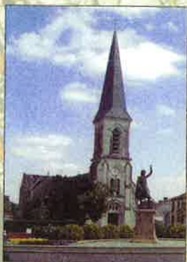
L'Eglise du Pin en Mauges