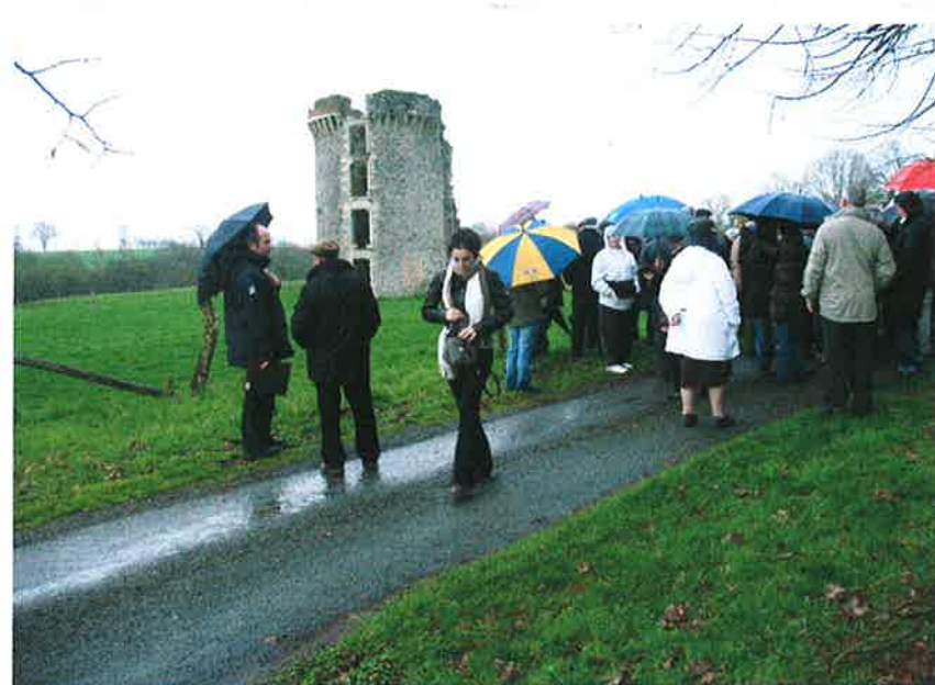
Château de La Bouère