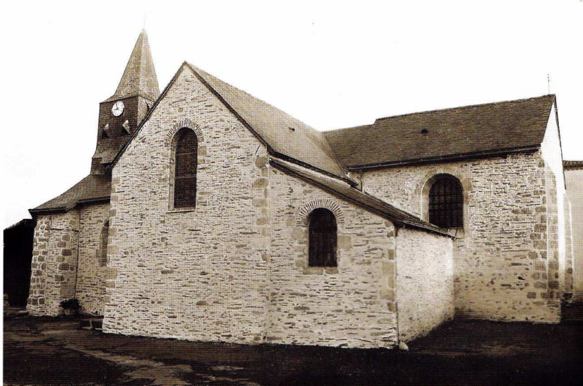
L'église de Saint-Philbert-en-Mauges a accueilli un curé peu orthodoxe.