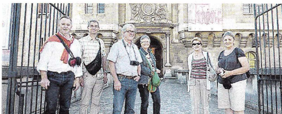
Les membres de la délégation du Grahl ont été émus devant la statue qui illustre l'importance du passé antique de la région de Beaupréau et du Fief-Sauvin.